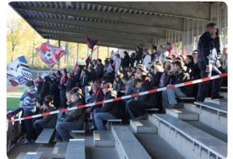
Das Sicherheitskonzept ging auf beim Heimspiel auf der Rußheide gegen den KFC Uerdingen

Große Kulissen hatte man sich erhofft, und sogar so genannte Sicherheitsspiele fanden statt. Diese durfte der TuS nicht in der heimischen BIPA Sport Arena austragen, man musste ausweichen auf die Bezirkssportanlage Rußheide.