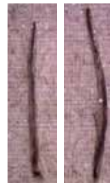
Haar ohne Coffein

Das Alpecin-Coffein dringt beim Haarewaschen in die Kopfhaut ein und erreicht schnell den Haarfollikel. Dort trägt das Coffein dazu bei, die Haarwurzel vom Schaft aus zu stärken. Die Wachstumssteigerung bei lebenden Haarwurzeln ist wissenschaftlich bewiesen (bei regelmäßiger, richtiger Dosierung).